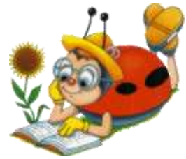
FOTORELACJA Z DRO CZYSTOŚĆ CI I WYCIECZEK