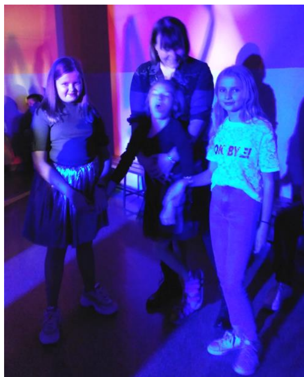
Wszyscy bawili się znakomicie!

W piątek 10 stycznia z inicjatywy SU odbył się apel „Bezpieczne ferie”, podczas którego przypomniano wszystkim uczniom zasady bezpieczeństwa podczas zimowego wypoczynku.